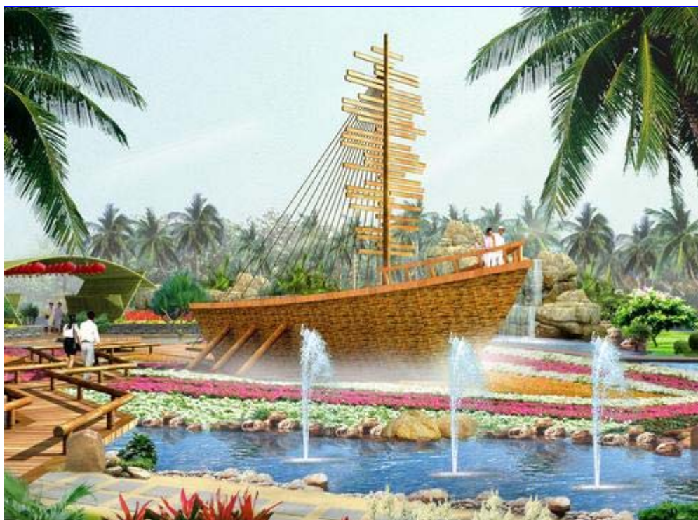
图 5：新加坡环境。新加坡从 40 年前那个混乱不堪的海港成为今天世界上最富裕、最安全、最高效的国家之一。

新加坡：快乐是法治 排名：49 首席参照物：环境 “我们感到安全……如果我们不违背法律，就不必担心”