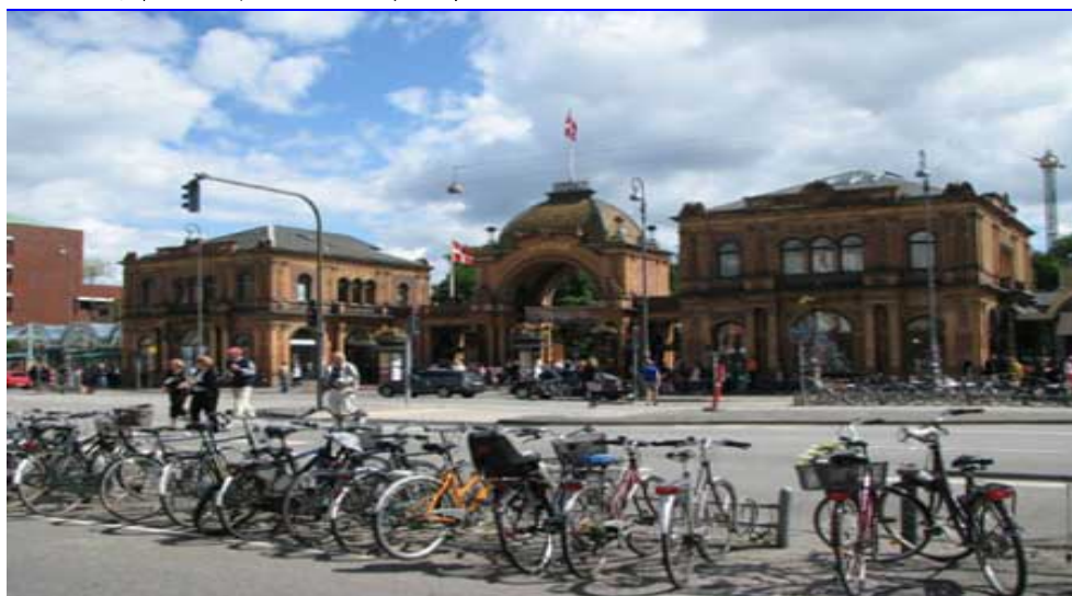
图 2：丹麦街道上的自行车。所有丹麦人都买得起汽车，但他们宁愿选择自行车，因为它简单、经济、环保、有利身体健康。

“既然银行家和艺术家都能过上体面的生活，人们便不会因为收入和社会地位有别来选择职业”。