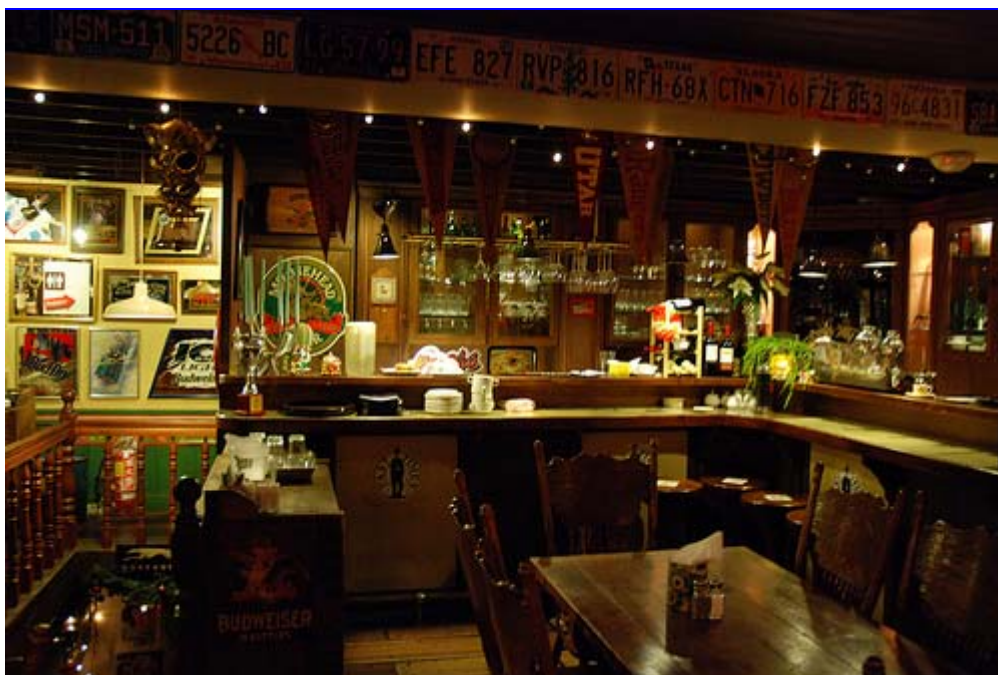
图 4：美国咖啡吧。“那里(阿什维尔)每隔几个店铺就有一家咖啡馆或书店，你在那里会有很强的社团归属感”

新加坡：快乐是法治 排名：49 首席参照物：环境 “我们感到安全……如果我们不违背法律，就不必担心”