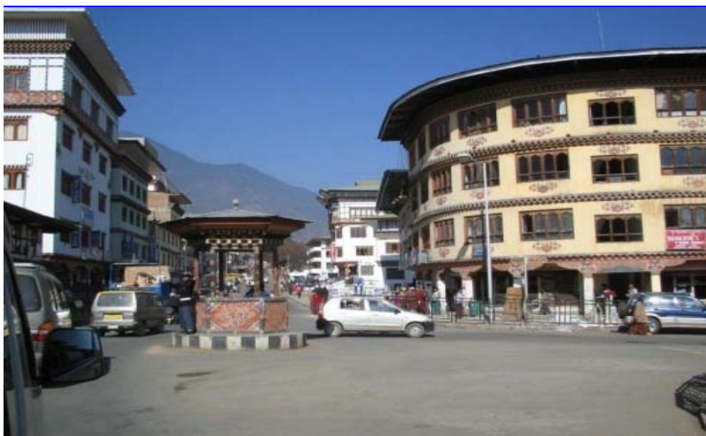
图 3：不丹的街道。不丹是现代社会中少有的不使用交通信号灯的国家，但街道干净整洁。

迄今世界只有不丹把“快乐”正式列为政策重心。这个位于喜马拉雅山上的小国自创了国家快乐总值。